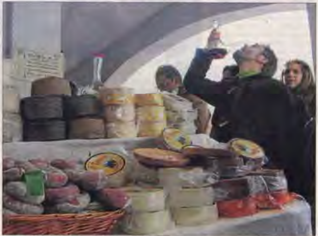
Un hombre prueba uno de los exquisitos vinos de la comarca.

Se han programado trenes especiales para acudir a la localidad y se han habilitado 1.000 plazas de aparcamiento