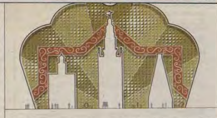
Otra de las portadas presentadas a concurso. A través de las torres.

poco entre los participantes falta la portada homenaje al Albero, al río Guadalquivir y a las Atarazanas, entre otras. La mayoría de las 45 propuestas son de corte clásico. Es el sexto año que Aparejadores acoge esta muestra de arquitectura efímera. 20 aniversario de la Expo 92, Agua de Sevilla, Cigarrera 1812, Casino de la Exposición, Entorno al 29, Nosotros, ellos, Ay feria mía, cuánto te quiero e History of a new world son los títulos de otras de las portadas presentadas a concurso que pueden contemplarse.