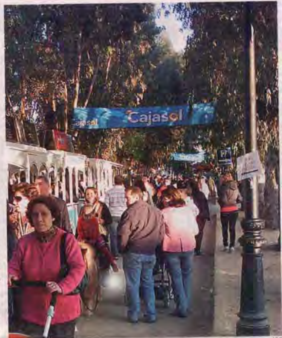
Pasar un día en El Pedroso es un buen plan para este fin de semana

Las actividades se extienden desde las 10:30 a las 19 horas. Además de ir en coche, Renfe aumenta las plazas disponibles para la línea ferroviaria que va a la localidad. Hay un servicio especial diario directo con salida de Santa Justa a las 10 horas y regreso a media tarde.