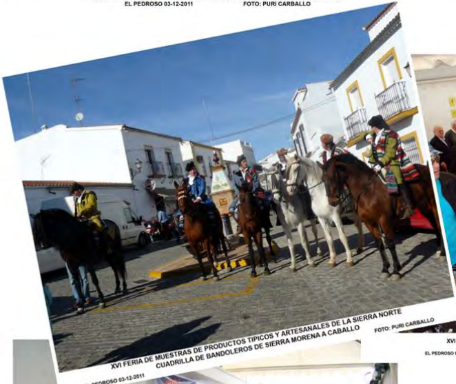
XVI FERIA DE MUESTRAS DE PRODUCTOS TÍPICOS Y ARTESANALES DE LA SIERRA NORTE CUADRILLA DE BANDEROLeros DE SIERRA MORENA A CABALLO EL PEDROSO 03-12-2011