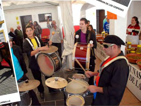
XVI FERIA DE MUESTRAS DE PRODUCTOS TÍPICOS Y ARTESANALES DE LA SIERRA NORTE PASACALLE "BATUKADA DEL CURRO"