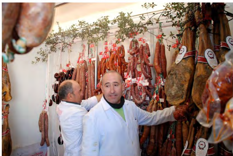
XVI FERIA DE MUESTRAS DE PRODUCTOS TÍPICOS Y ARTESANALES DE LA SIERRA NORTE PLAZA DE ABASTOS EL PEDROSO 05-12-2011