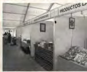
La feria se desarrollará del 3 al 6 de diciembre.

La XIII Feria de Muestras de Productos Típicos y Artesanales de la Sierra Norte de Sevilla en El Pedroso incluirá entre los eventos culturales y lúdicos que se organizan cada año la celebración de una Feria de la Tapa, para que los numerosos visitantes puedan degustar los platos de la gastronomía serrana y pedrosea. Para ello, el consistorio pondrá una carpa a disposición de los diferentes restauradores de la localidad, quienes podrán dar a conocer sus distintas especialidades culinarias.