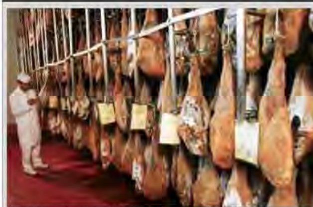
Una de las fábricas de jamones de El Pedroso, uno de los productos estrella de la Feria.