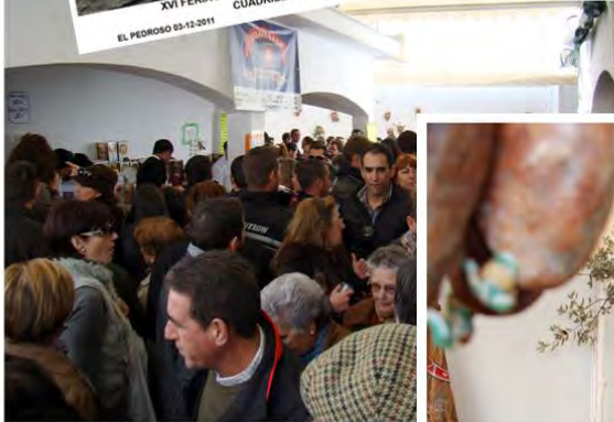
XVI FERIA DE MUESTRAS DE PRODUCTOS TÍPICOS Y ARTESAN PLAZA DE ABASTOS EL PEDROSO 06-12-2011