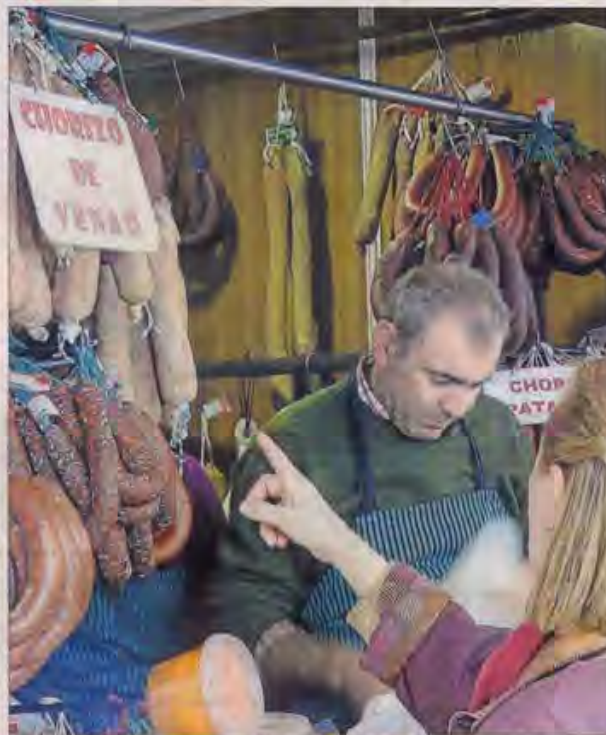
Los productos más deseados de la Sierra Norte se exhibirán la semana que viene en la feria de muestras.

Las aves rapaces convivirán en la Feria de Muestra de Productos Típicos y Artesanales de la Sierra Norte con los perros, ya que habrá una exhibición de la Unidad Canina de Rescate Alpina, con sede en Villaverde del Río. Frente al pabellón principal, los perros adiestrados realizarán dos ejercicios: uno sobre dificultad de búsqueda de personas entre los escombros, para lo que tendrán que localizar a una persona del público escondida por los adiestradores, y otro sobre localización de personas fallecidas para lo que los canes en-