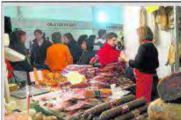
Los puestos de embutidos abundan en la Feria ya que son los productos estrella de la Sierra Norte.