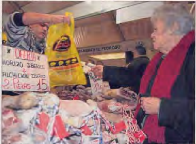
Una mujer adquiere producto típico de la Sierra Norte en la Feria de El Pedroso.

Pero por si estos motivos no son ya más que suficientes para acudir a la muestra, el Ayuntamiento de El Pedroso también programa actividades paralelas como la exposición y exhibición de aves rapaces Águilas de Andalucía ; la exhibición de la unidad canina de rescate Alpica, la muestra de